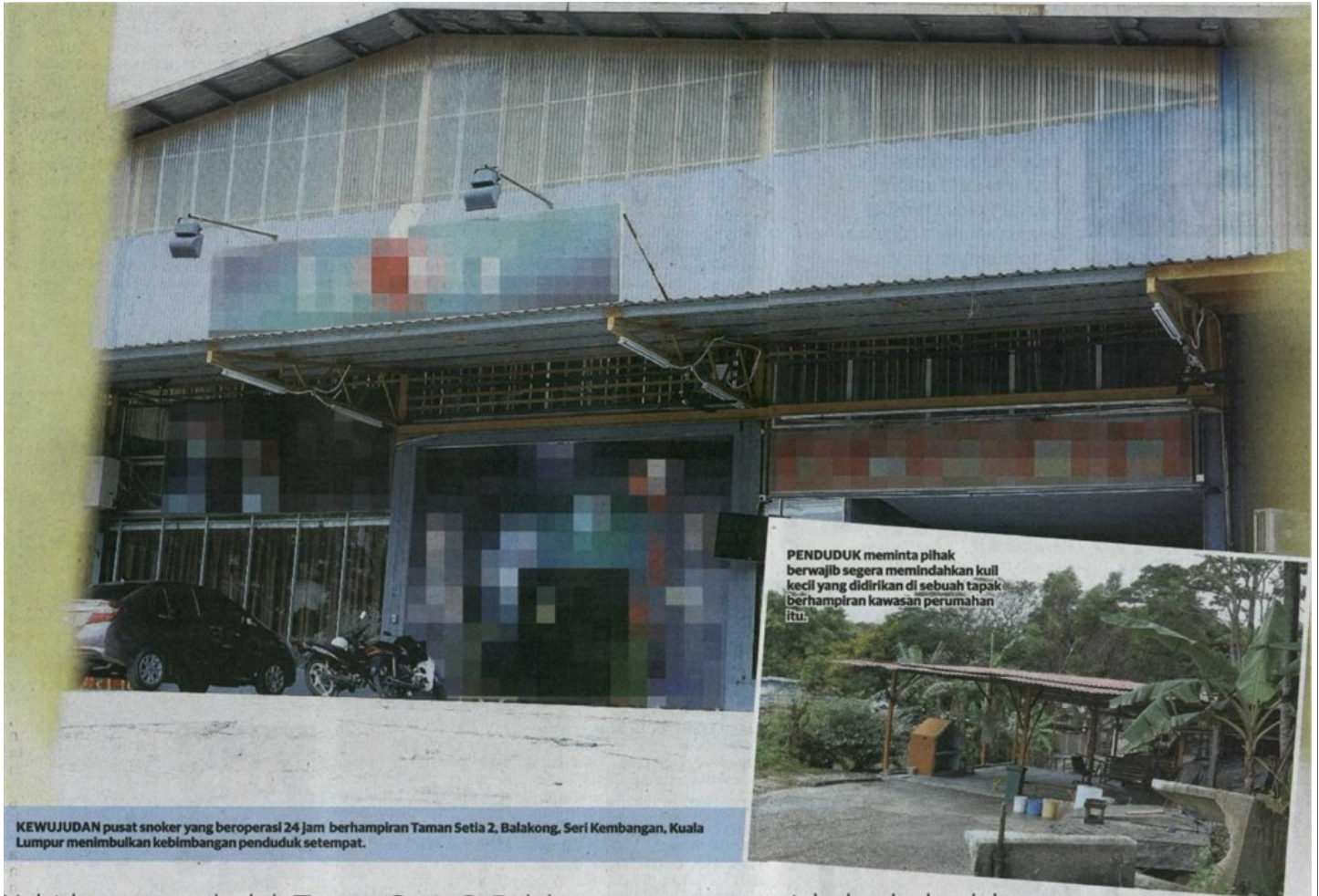
KEWUJUDAN pusat snoker yang beroperasi 24 jam berhampiran Taman Setia 2, Balakong, Seri Kembangan, Kuala Lumpur menimbulkan kebimbangan penduduk setempat.

Provided for client's internal research purposes only. May not be further copied, distributed, sold or published in any form without the prior consent of the copyright owner.