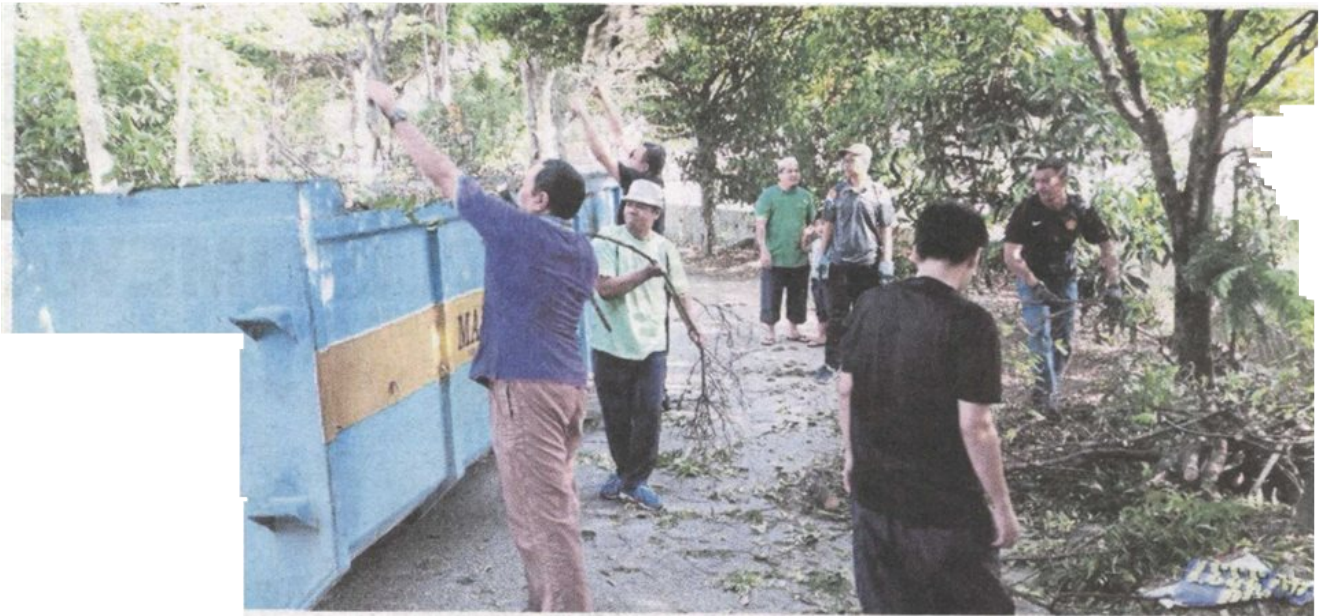
PENDUDUK bergotong-royong menurunkan iklan haram dan mencantas ranting pokok di kawasan perumahan Impian Setia.

Provided for client's internal research purposes only. May not be further copied, distributed, sold or published in any form without the prior consent of the copyright owner.