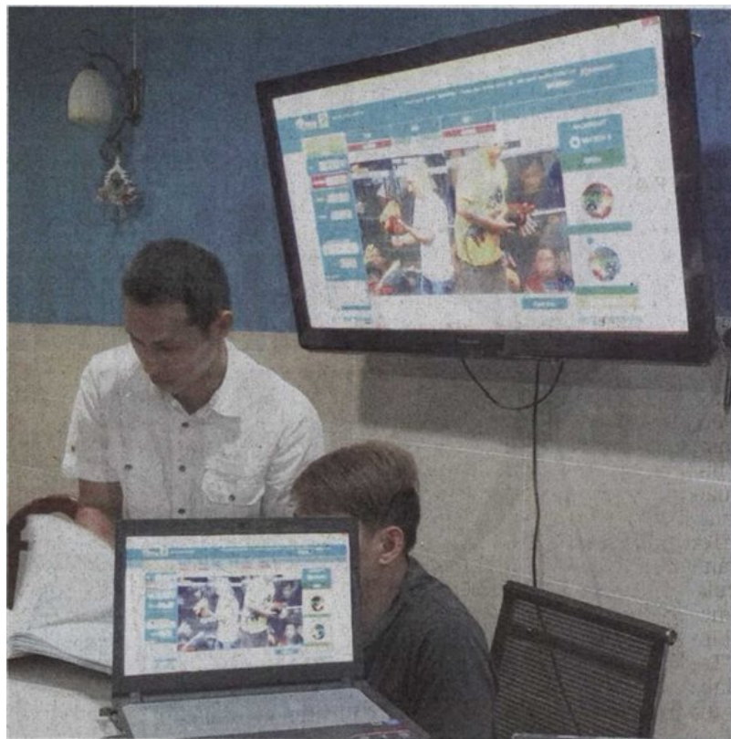
SEORANG anggota polis memeriksa buku dan peralatan perjudian sabung ayam yang dikesan menggunakan kaedah atas talian.

Provided for client's internal research purposes only. May not be further copied, distributed, sold or published in any form without the prior consent of the copyright owner.