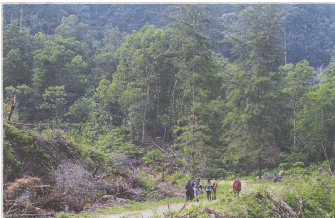
Works on the proposed SUKE expressway will start in Lembah Maju, following MPAJ's approval. Part of the Sungai Puteh Forest Reserve in Ampang will be degazetted for the project.