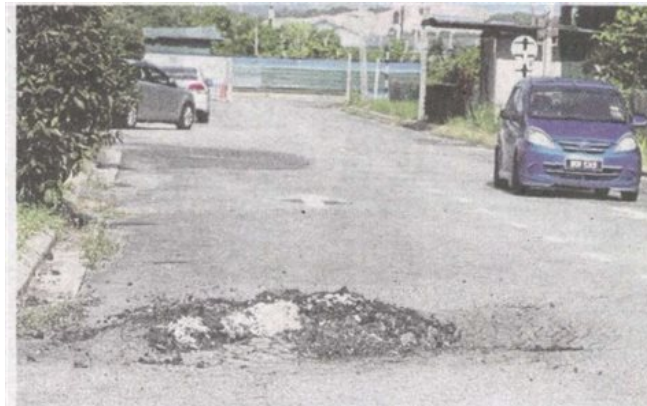
JALAN rosak akibat lori pasir yang masuk ke kawasan perumahan Taman Desa Restu.

Provided for client's internal research purposes only. May not be further copied, distributed, sold or published in any form without the prior consent of the copyright owner.