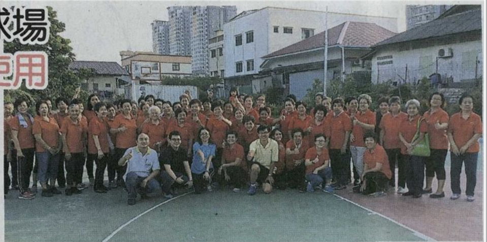
■马华灵北区会一行人拜访拉筋健身操组织。

国, 届时全国将有约30%人口是乐龄人士, 因此必须作好准备, 尤其是健康福利方面。