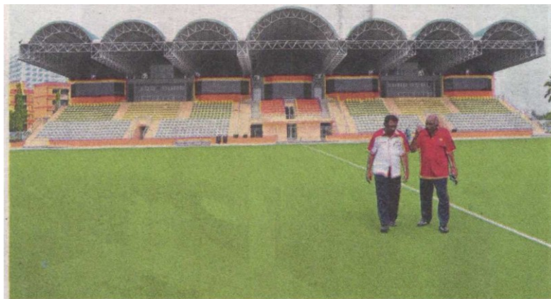
MPK recently spent RM3.8mil to refurbish the stadium and spends RM15,000 a month on maintenance.