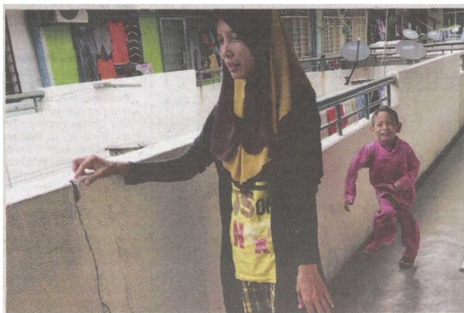
PENDUDUK menunjukkan rekahan pada tembok di Flat Taman Puchong Permai Fasa 1C.

“Untuk makluman, Bahagian Pesuruhjaya Bangunan (COB) MPSJ sudah membuat lawatan dan pemeriksaan ke flat berkenaan. Semakan melalui pejabat MC juga mendapati aduan dibuat pada tahun lalu sudah diambil tindakan, bagaimana pun tiada aduan baru dibuat mengenai keretakan berkenaan pada kali ini,” katanya.