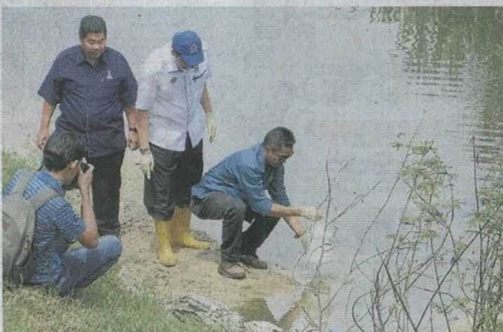
度。 环境局官员测试士毛月河受污染程