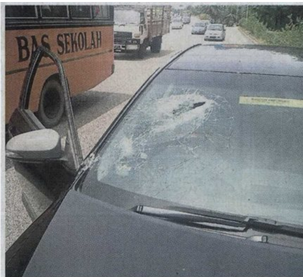
■物件砸中的位置，刚好的是司机座位的挡风镜。