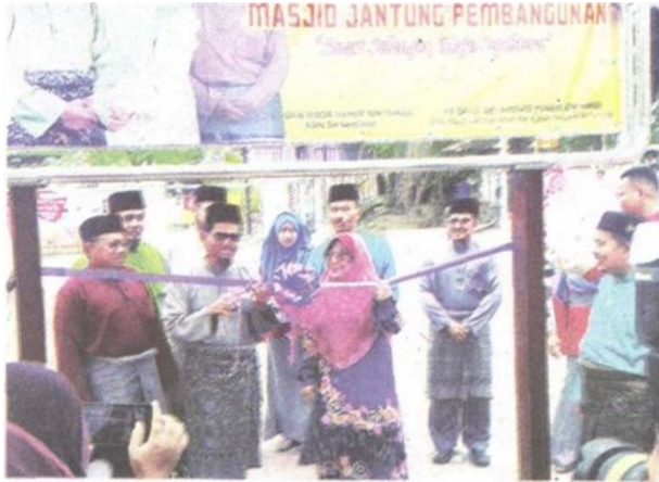
Kesepakatan antara exco dan Adun PAS untuk menjayakan program 3K dengan menjadikan Masjid sebagai Jantung Pembangunan.

Provided for client's internal research purposes only. May not be further copied, distributed, sold or published in any form without the prior consent of the copyright owner.