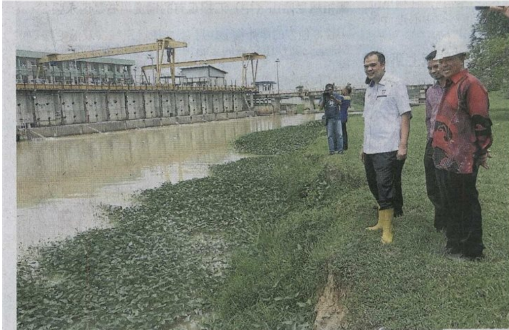
■ 佐汉（在）在沙阿里陪同下，巡视布城滤水站的泵水站。

Provided for client's internal research purposes only. May not be further copied, distributed, sold or published in any form without the prior consent of the copyright owner.