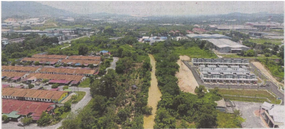
Sungai Semenyih merentasi kawasan perindustrian Hi-Tech, Semenyih yang didakwa menjadi punca pencemaran.