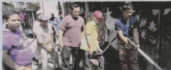
Penduduk bekerjasama dengan anggota bomba dalam gotong-royong berkenaan.

"Saya bangga dengan anak muda yang turut bersama meluangkan masa dalam aktiviti seperti ini," katanya.