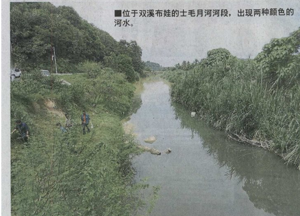
■ 位于双溪布娃的士毛月河河段，出现两种颜色的河水。